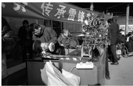
地区服务商在为居民配钥匙