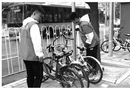
月坛社区志愿者摆放共享单车