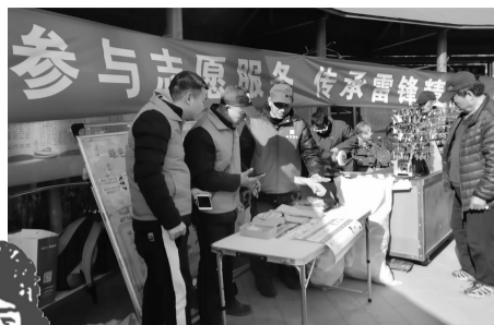
复北社区学雷锋志愿活动