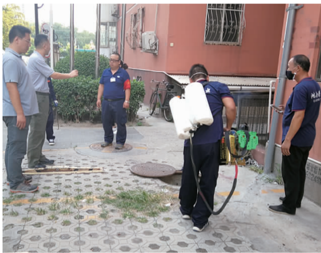
消杀下水道里的蟑螂

街道今年启动的四大类片区综合整治项目，涉及29个小区、61栋楼、33条背街小巷，并研究制定了《广外街道整治提升三年行动方案（2019—2021年）》，从施工扰民类、环境提升类、交通疏堵类、老旧小区综合改造类、基础设施完善类、停车秩序类、拆违腾退类7个方面进行梳理，逐步实施，从而改善小区环境面貌。