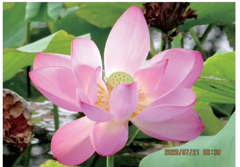
《绽放》 ■社会路社区 白荣舜